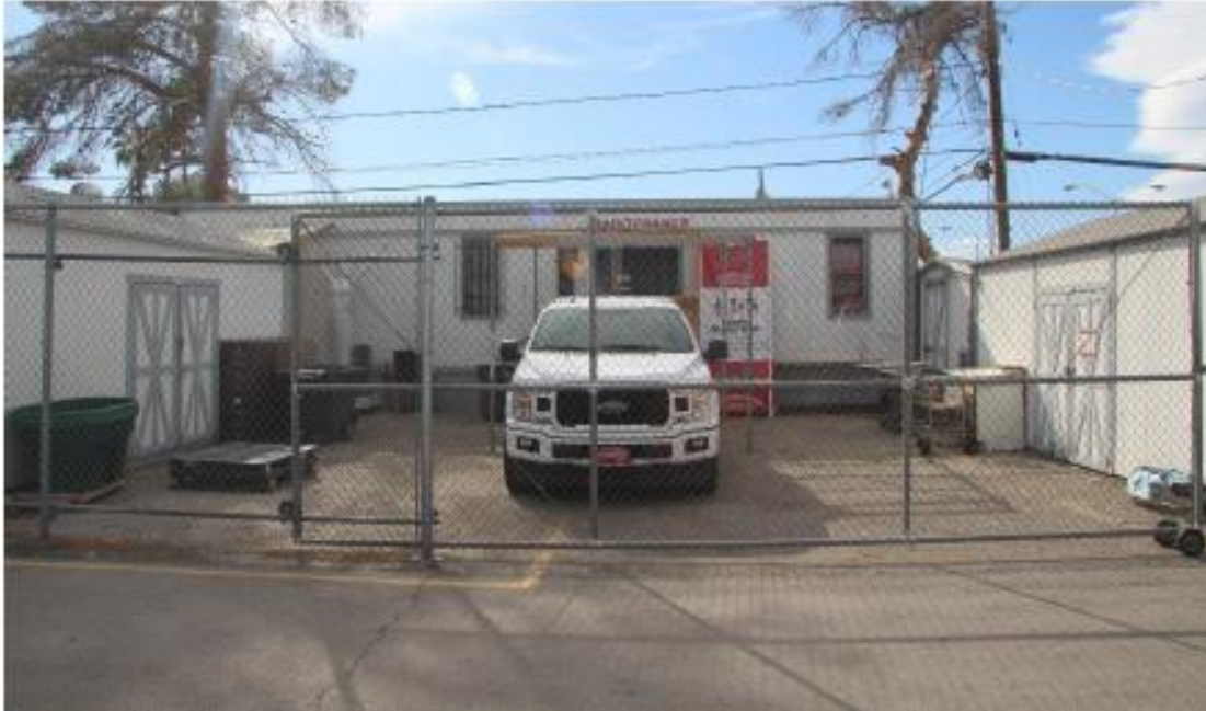
Fotografía 13 de 13

Condado de Clark, Nevada Condado y estado