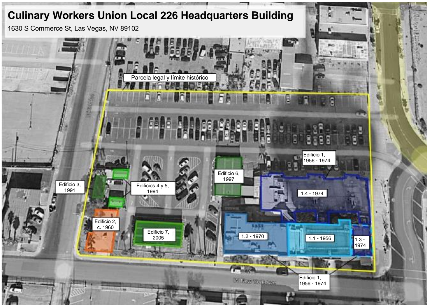
Plano del sitio

Condado de Clark, Nevada Condado y estado