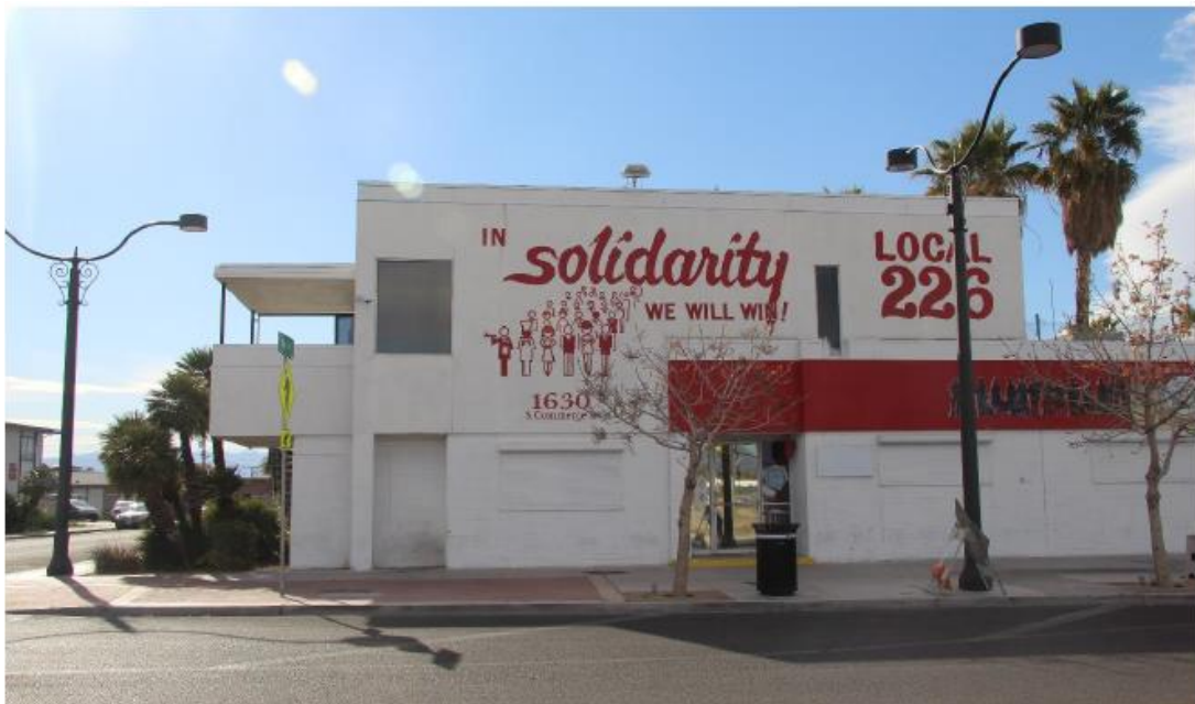
Fotografía 2 de 13