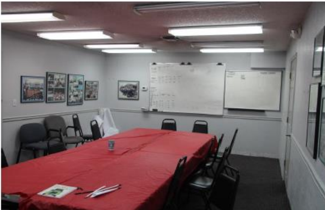
Fotografía 10 de 13