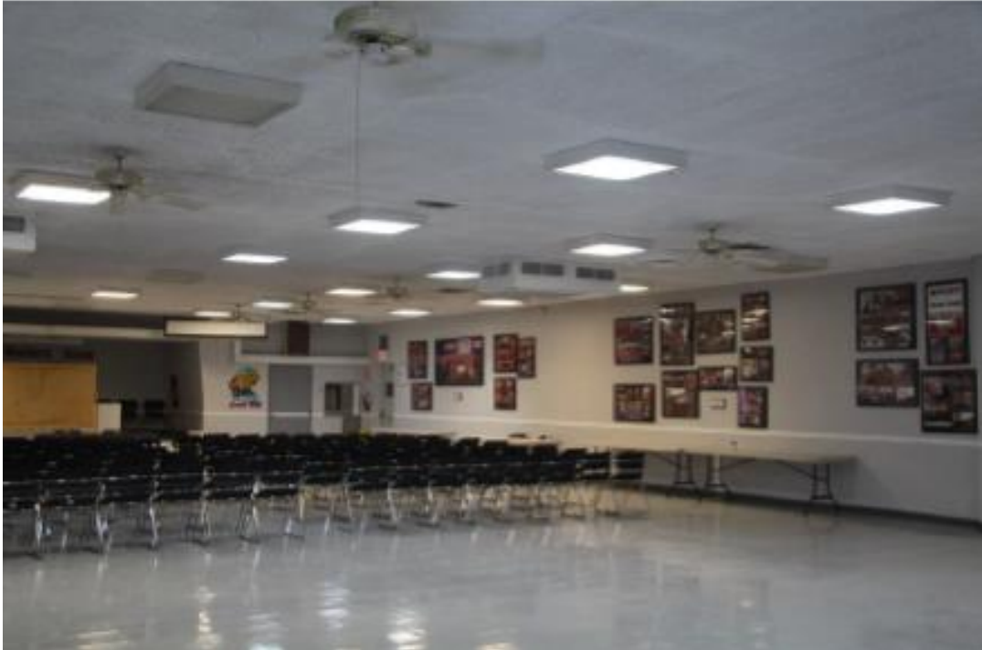
Fotografía 7 de 13

Condado de Clark, Nevada Condado y estado