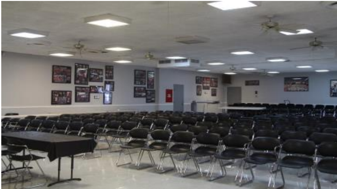
Fotografía 8 de 13