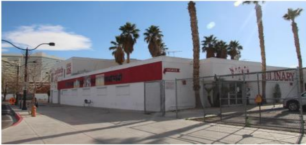
Fotografía 3 de 13

Condado de Clark, Nevada Condado y estado