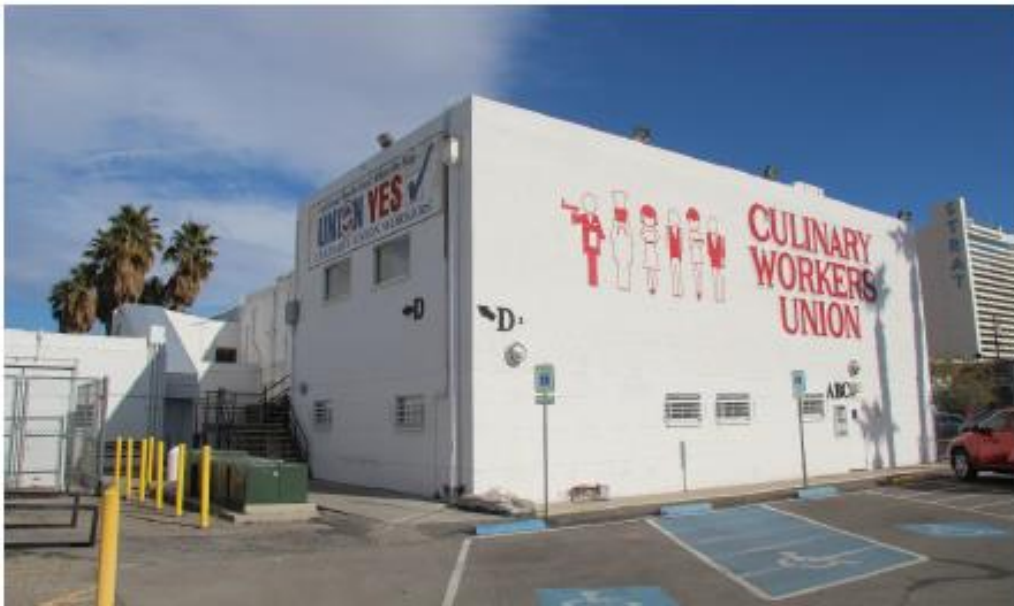
Fotografía 6 de 13