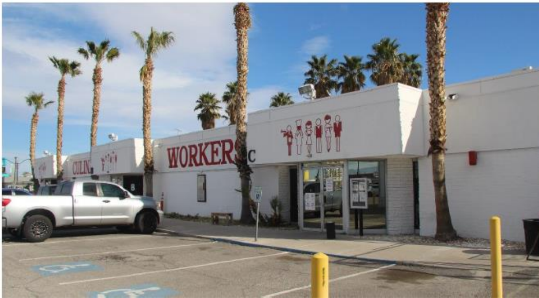
Fotografía 4 de 13