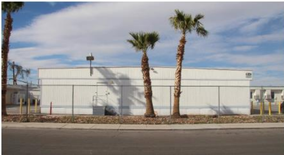
Fotografía 12 de 13