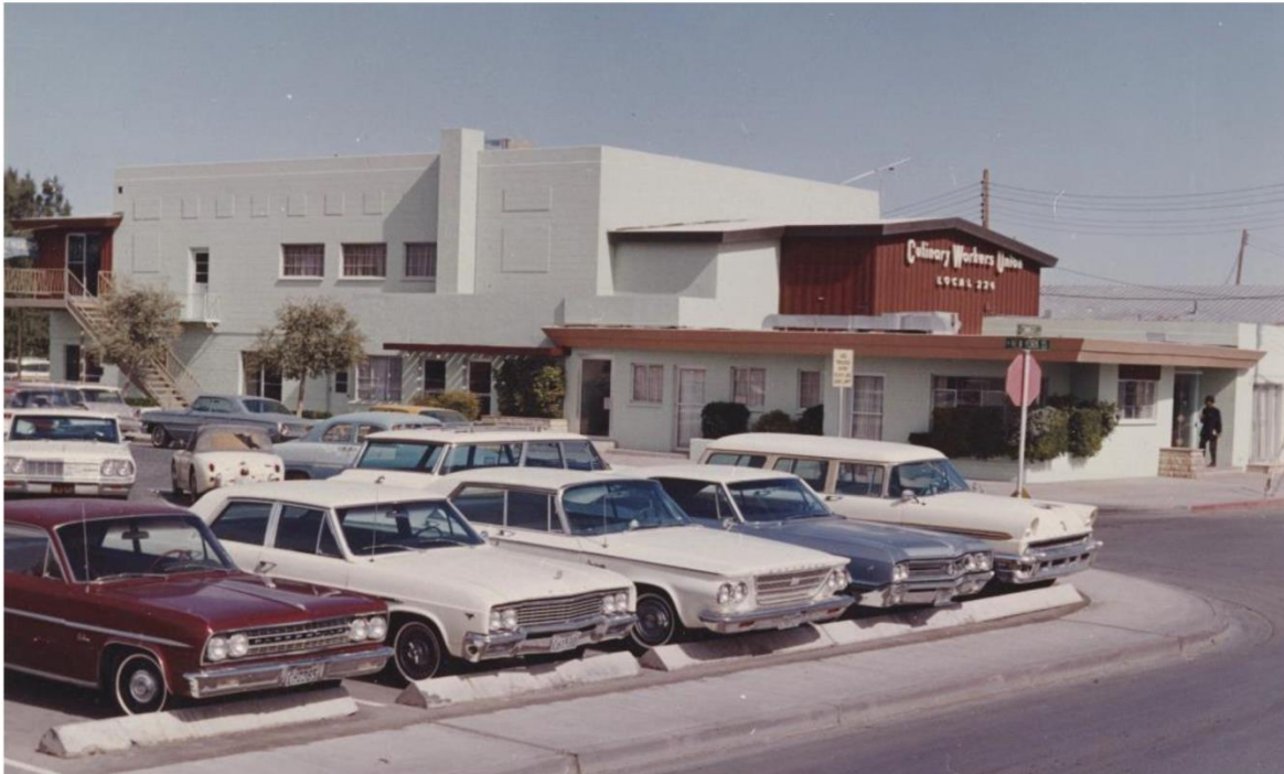
Figura 1. Una fotografía de alrededor de 1960 del Culinary Union Building construido en 1956. 5

El salón del club para miembros incluye una cafetería y un comedor para almorzar y un bar reglamentario para fiestas. Estas instalaciones son solo para miembros. Hay dos salas de televisión separadas para hombres y mujeres con una hermosa decoración. Arriba de las oficinas hay una sala de reuniones ultramoderna con capacidad para más de 400 personas. La sala, que tiene entrada privada, estará abierta al público en régimen de alquiler. ... El 15 de febrero, el gimnasio estará abierto para los miembros y para el público en general. Todos los servicios estarán disponibles. Con departamentos separados para hombres y mujeres. ... Próximamente habrá un estacionamiento para unos 50 autos. 4