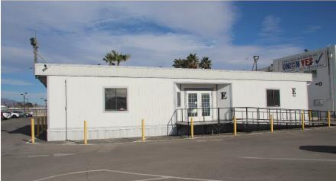
Fotografía 11 de 13

Condado de Clark, Nevada Condado y estado