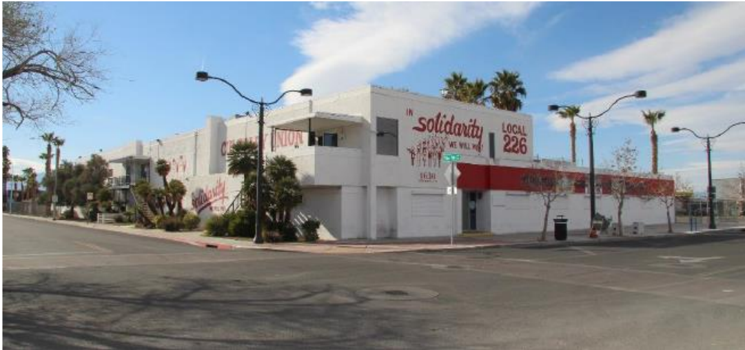
Fotografía 1 de 13

Condado de Clark, Nevada Condado y estado