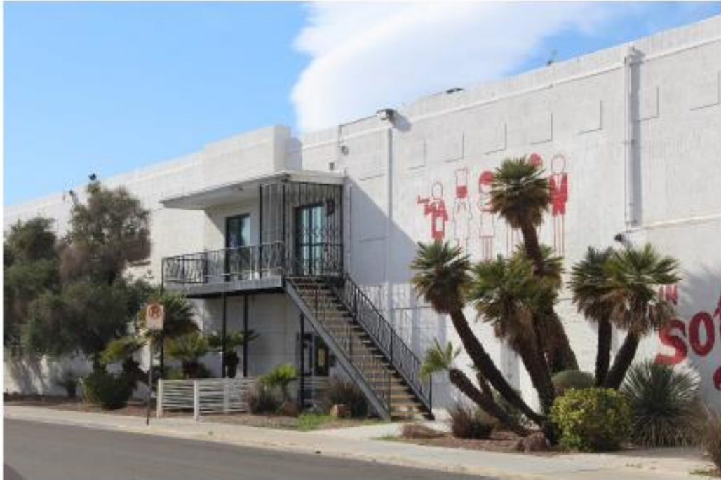
Fotografía 5 de 13

Condado de Clark, Nevada Condado y estado