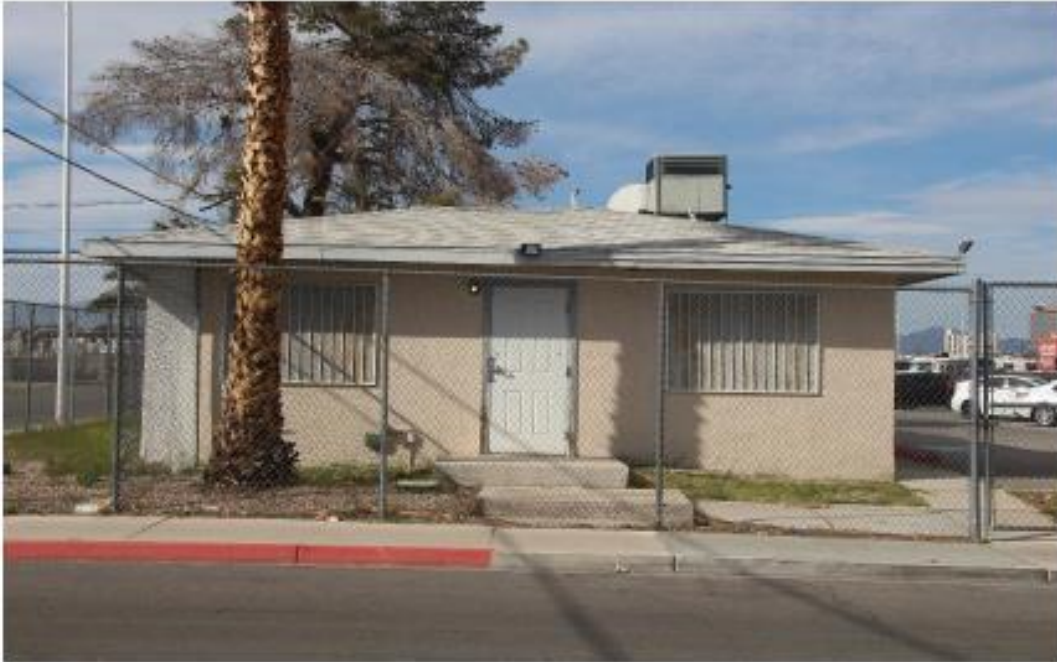
Fotografía 9 de 13

Condado de Clark, Nevada Condado y estado