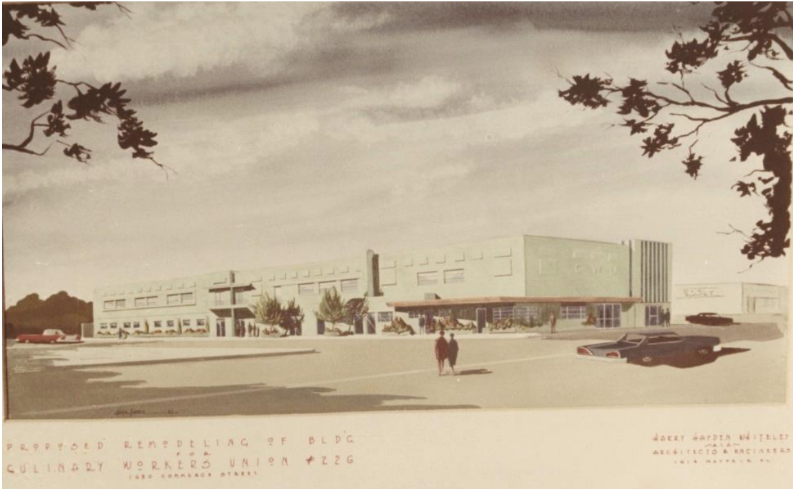
Figura 2. Boceto de la remodelación del edificio de Harry Hayden Whiteley, con fecha de 1967. 7

Condado de Clark, Nevada Condado y estado